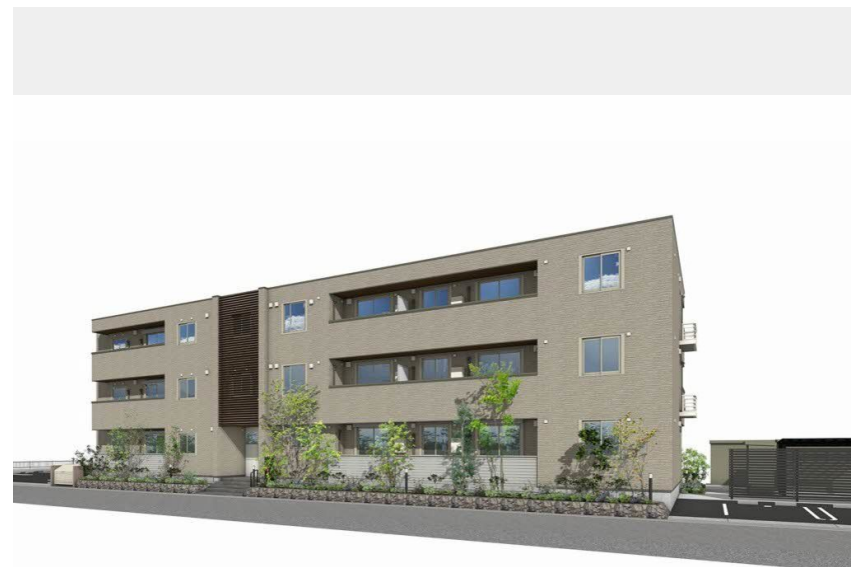
※写真は完成予想図です。 パースは実際の図面をもとに描き起こしたイメージで、実際のものとは異なる場合があります。