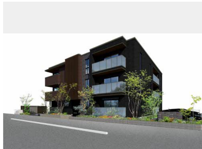
※写真はイメージです パースは実際の図面をもとに描き起こしたイメージで、実際のものとは異なる場合があります