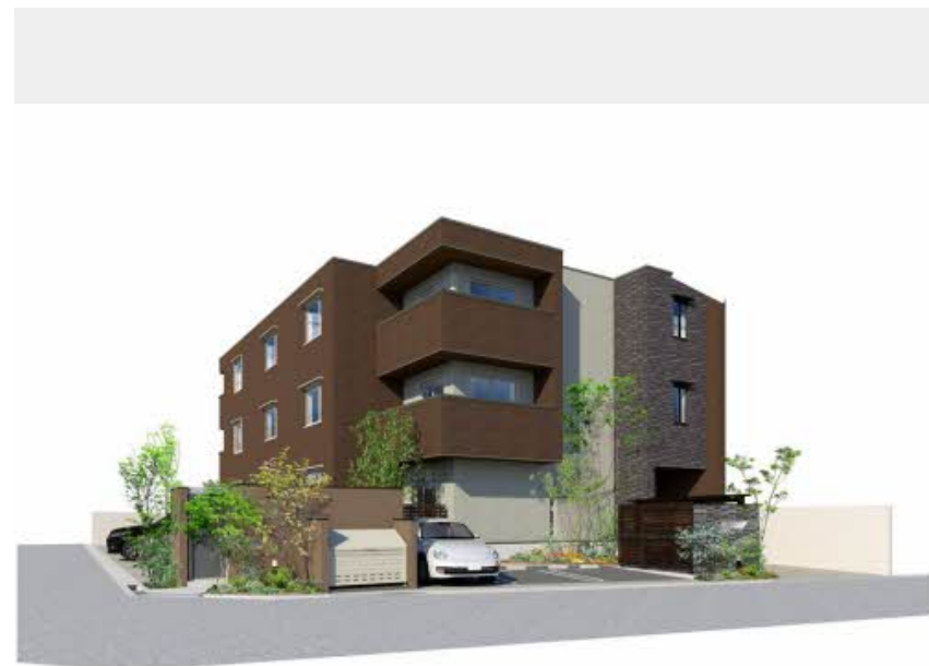
※写真はイメージです パースは実際の図面をもとに描き起こしたイメージで、実際のものとは異なる場合があります