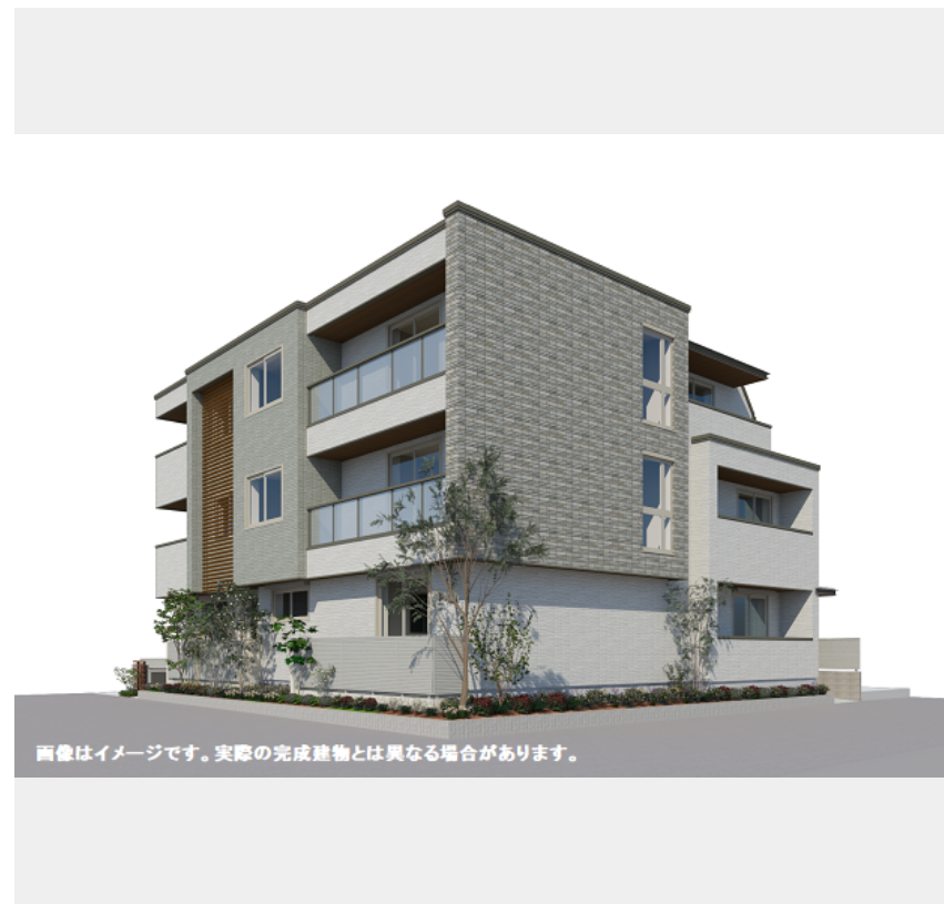
画像はイメージです。実際の完成建物とは異なる場合があります。