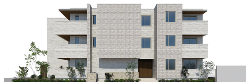
画像はイメージです。実際の完成建物とは異なる場合があります。