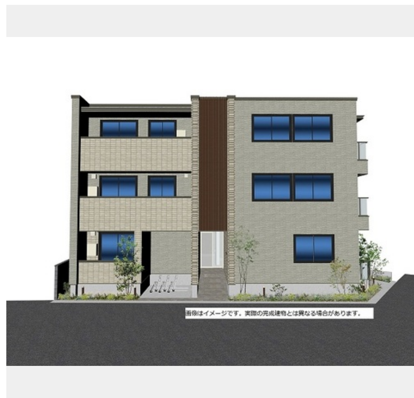
画像はイメージです。実際の完成建物とは異なる場合があります。