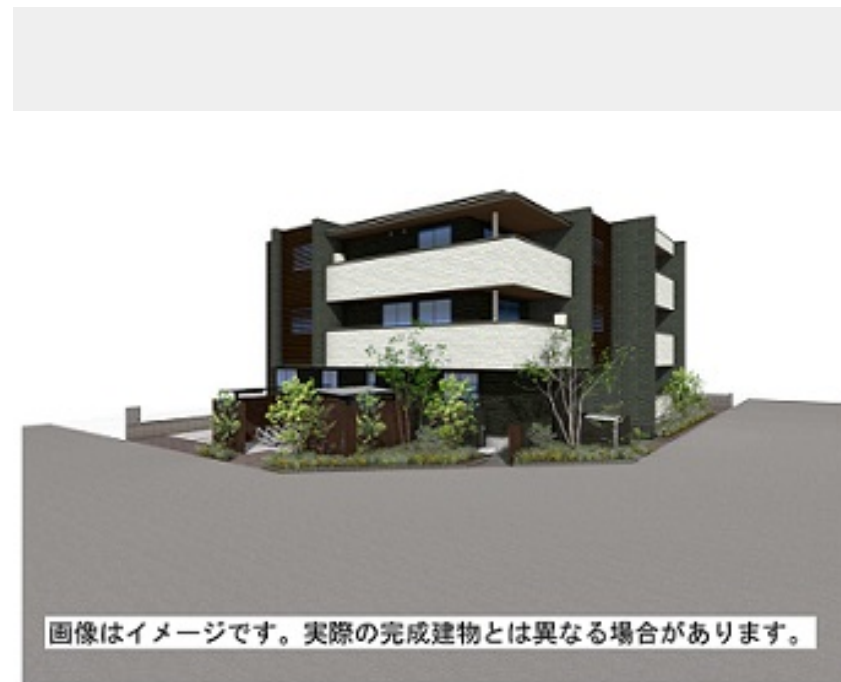
画像はイメージです。実際の完成建物とは異なる場合があります。