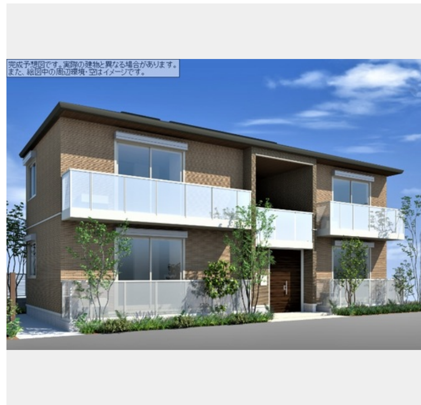
完成予想図です。実際の建物と異なる場合があります。また、絵図中の周辺環境・空はイメージです。