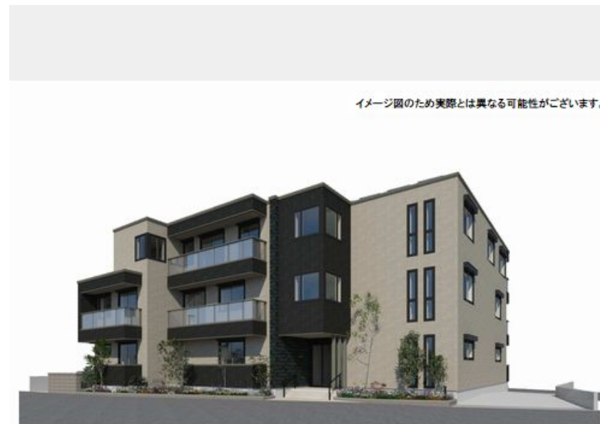
イメージ図のため実際とは異なる可能性があります。