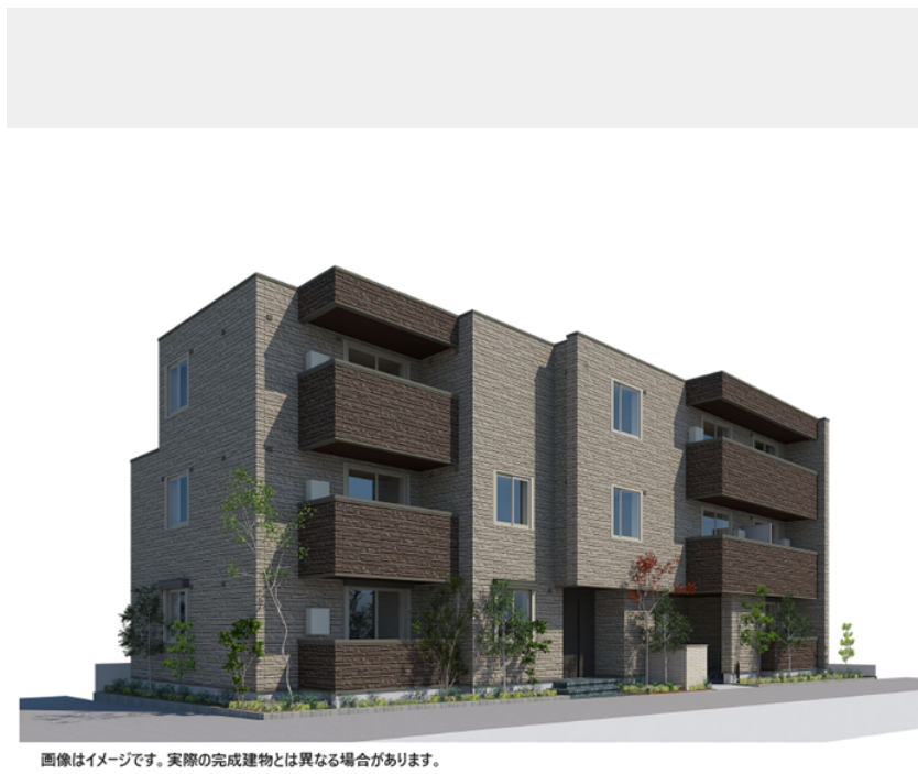
画像はイメージです。実際の完成建物とは異なる場合があります。