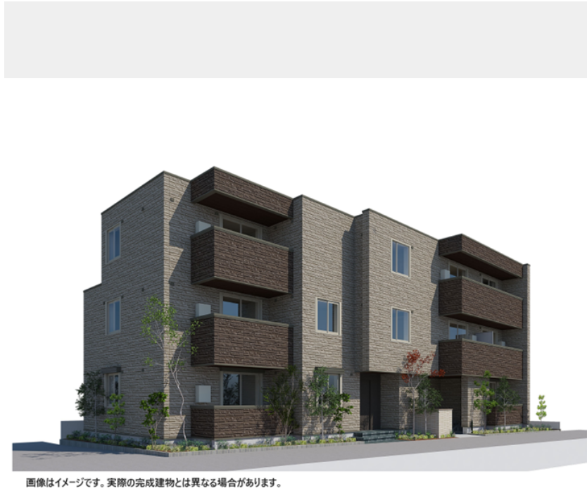
画像はイメージです。実際の完成建物とは異なる場合があります。