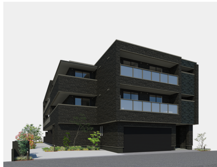
画像はイメージです。実際の完成建物とは異なる場合があります。