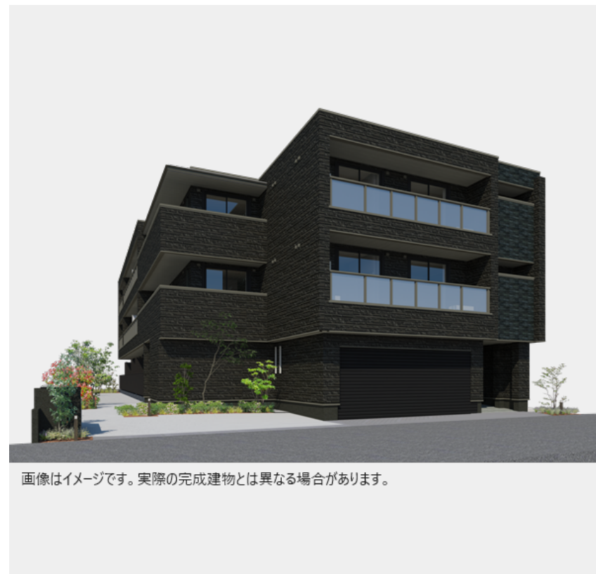
画像はイメージです。実際の完成建物とは異なる場合があります。