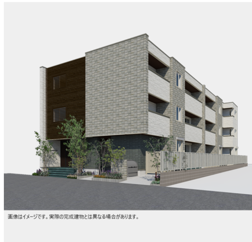
画像はイメージです。実際の完成建物とは異なる場合があります。