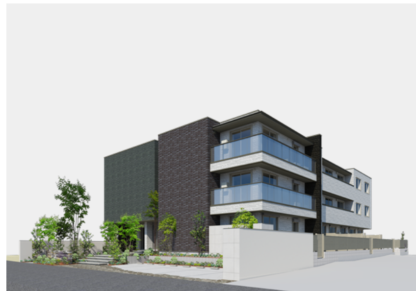
画像はイメージです。実際の完成建物とは異なる場合があります。