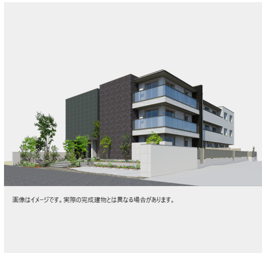
画像はイメージです。実際の完成建物とは異なる場合があります。