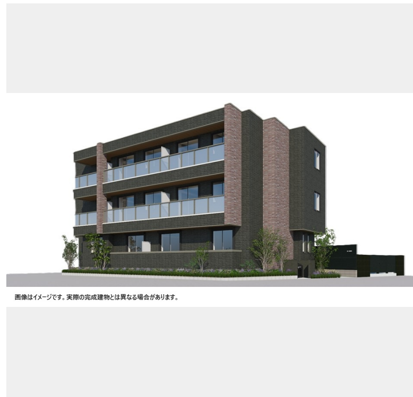
画像はイメージです。実際の完成建物とは異なる場合があります。