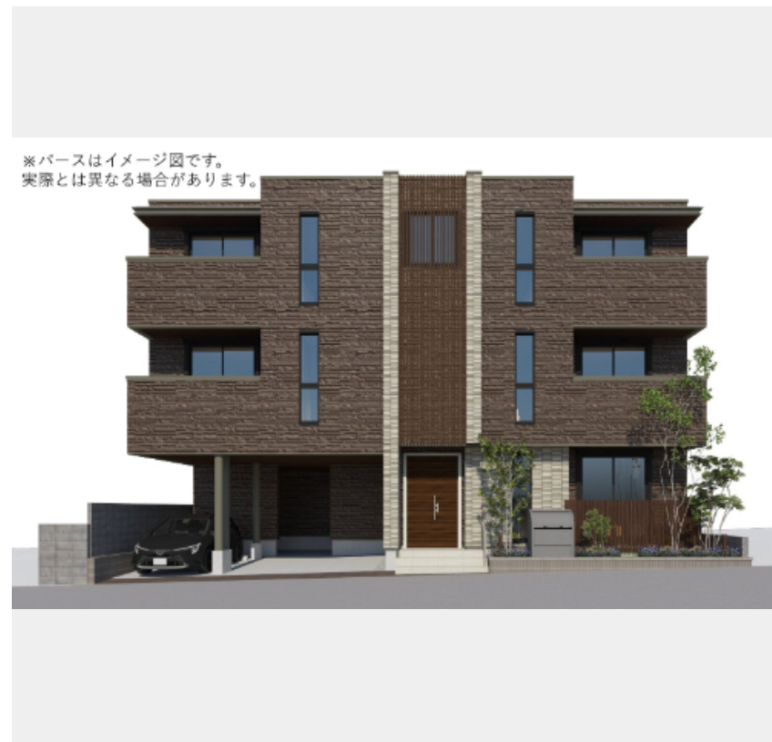
※パースはイメージ図です。実際とは異なる場合があります。