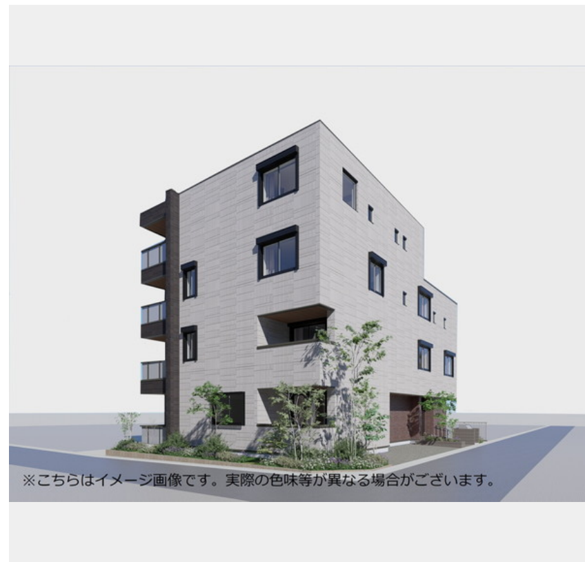
※こちらはイメージ画像です。実際の色味等が異なる場合がございます。