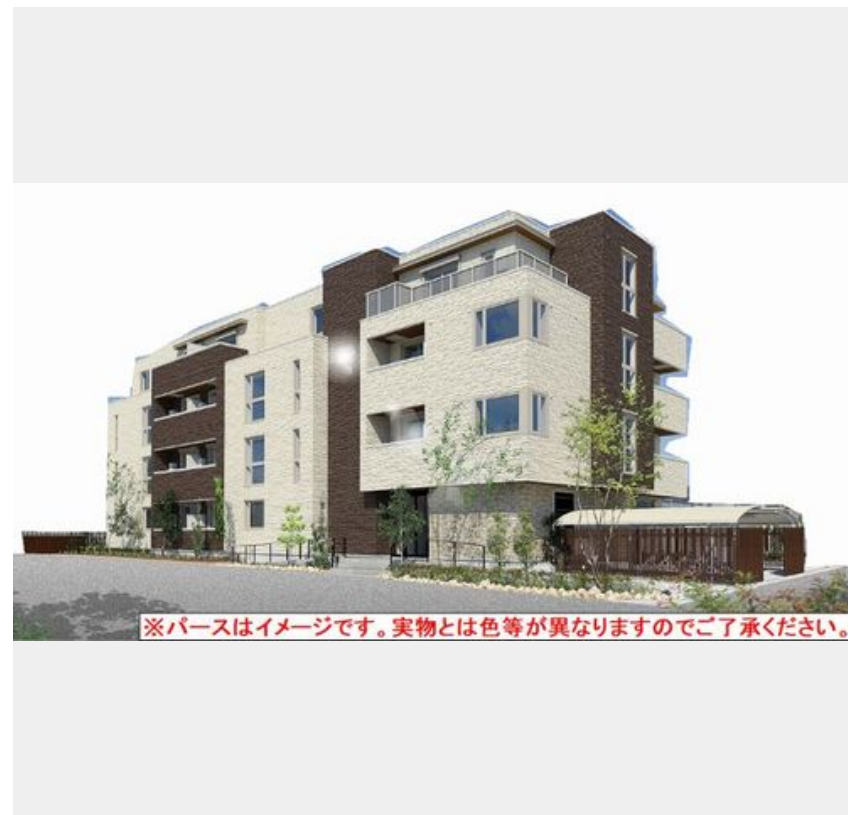
※パースはイメージです。実物とは色等が異なりますのでご了承ください。