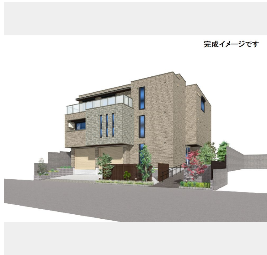
完成イメージです