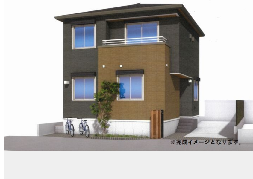
※完成イメージとなります。