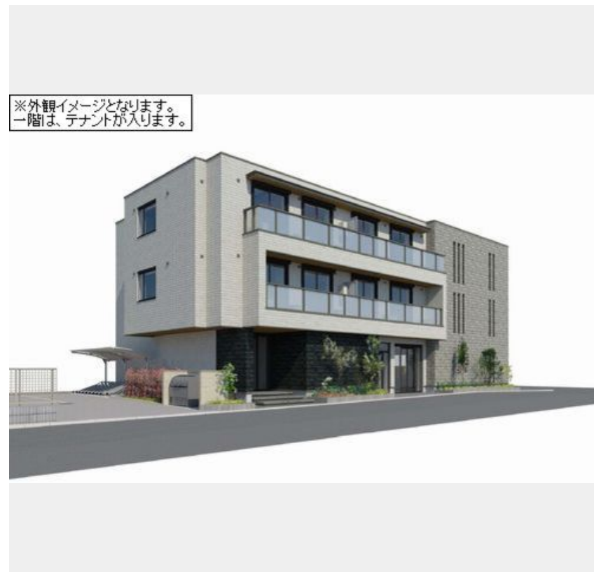
※外観イメージとなります。一階は、テナントが入ります。