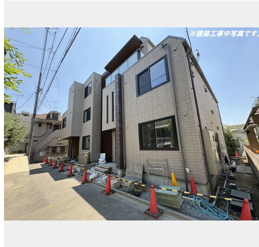
※建築工事中写真です。