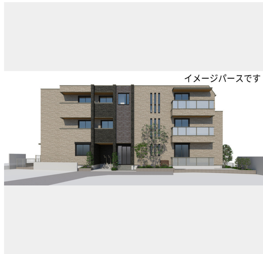
イメージパースです