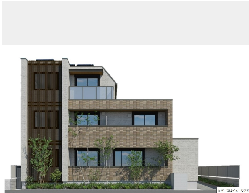
※パースはイメージです