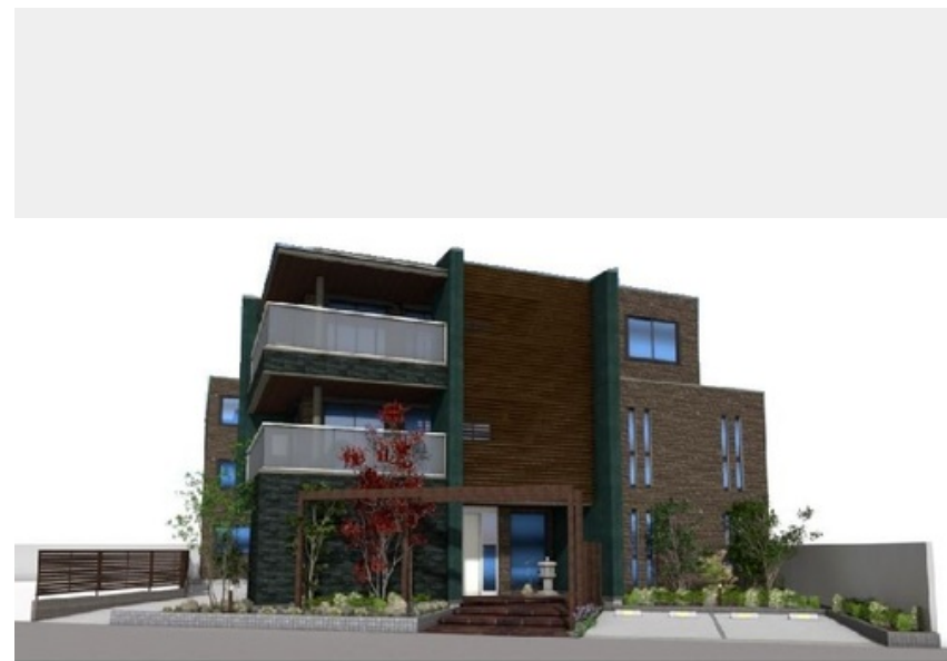
※完成イメージ図の為、色や仕様は現況が優先されます。