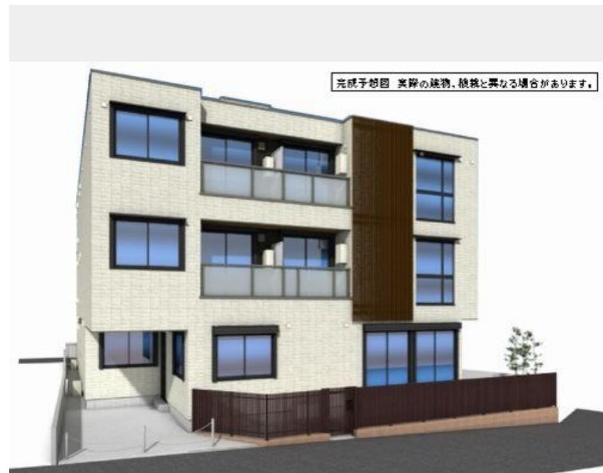
完成予想図 実際の建物、仕様と異なる場合があります。