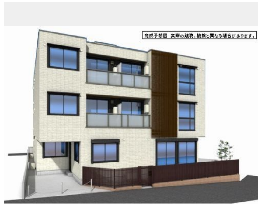
完成予想図 実際の建物、仕様と異なる場合があります。