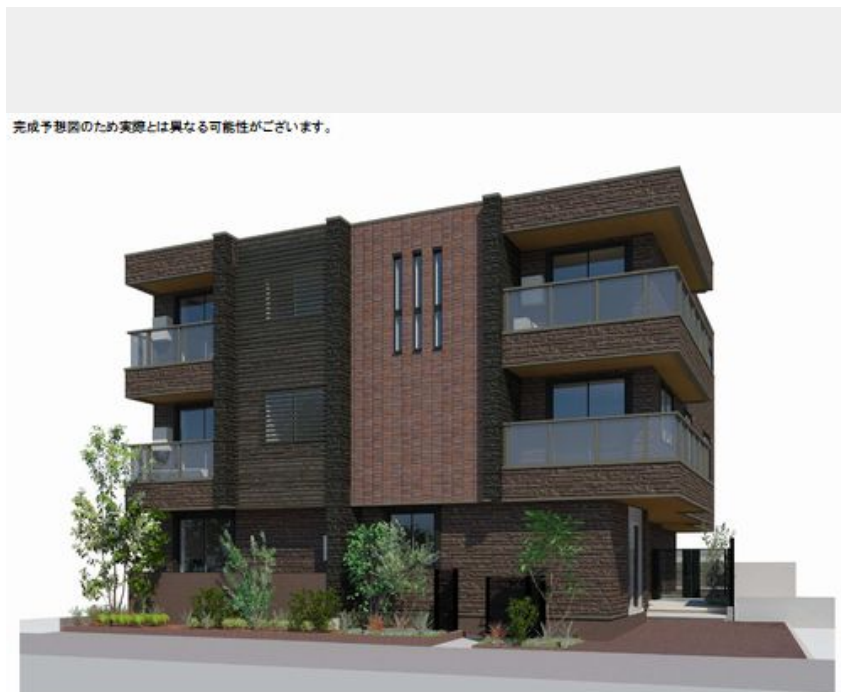
完成予想図のため実際とは異なる可能性があります。