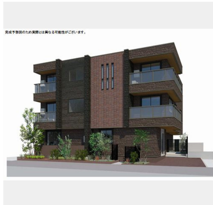
完成予想図のため実際とは異なる可能性があります。