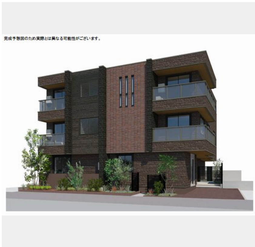
完成予想図のため実際とは異なる可能性があります。