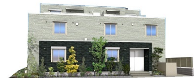
※こちらはイメージです。 実物とは色合いや質感が異なる場合がございます。