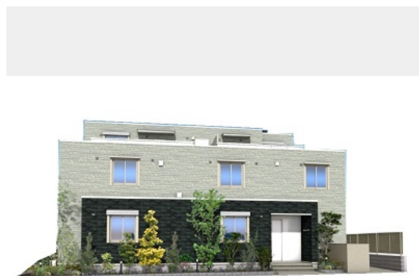
※こちらはイメージです。 実物とは色合いや質感が異なる場合がございます。