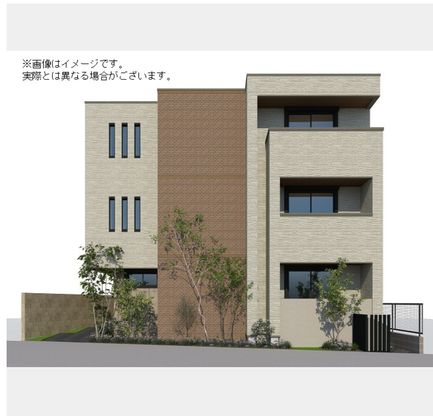
※画像はイメージです。実際とは異なる場合がございます。