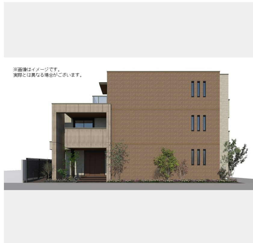
※画像はイメージです。実際とは異なる場合がございます。