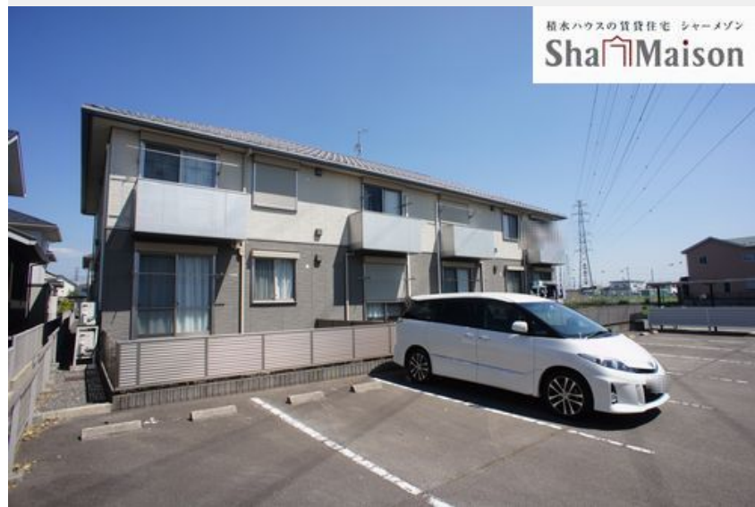
積水ハウスの賃貸住宅 シャーメゾン Sha Maison