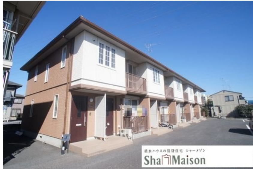
積水ハウスの賃貸住宅 シャーメゾン Sha Maison