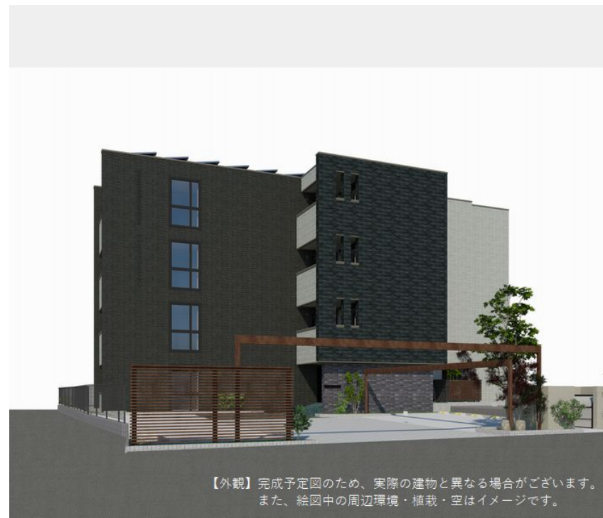
【外観】完成予定図のため、実際の建物と異なる場合がございます。また、絵图中的の周辺環境・植栽・空はイメージです。