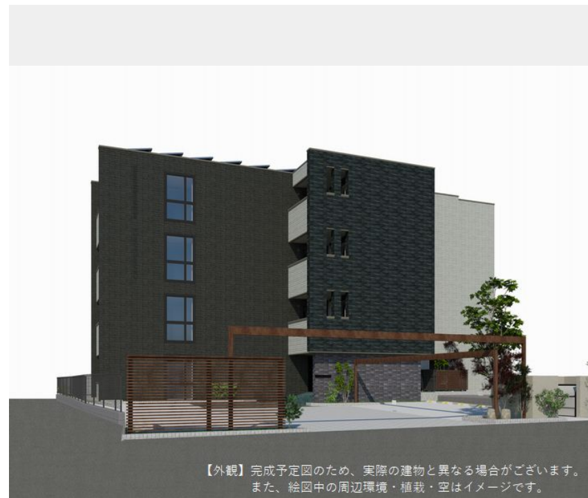
【外観】完成予定図のため、実際の建物と異なる場合がございます。また、絵图中的の周辺環境・植栽・空はイメージです。