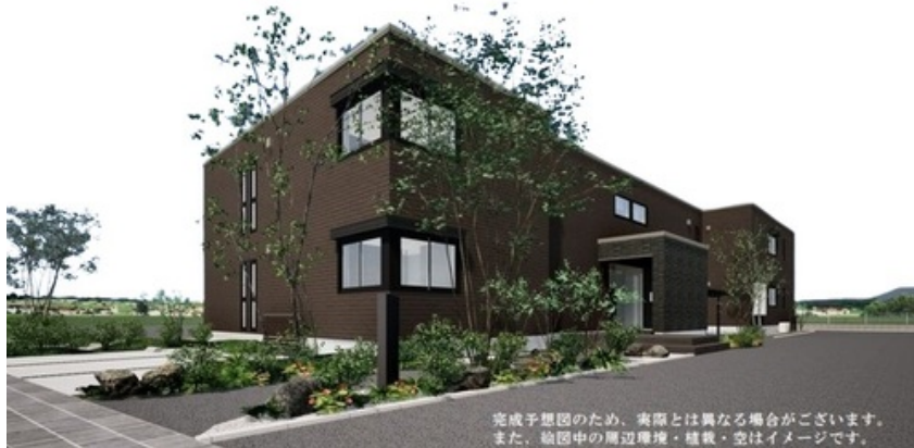
完成予想図のため、実際とは異なる場合がございます。また、絵图中的な周辺環境・植栽・空はイメージです。