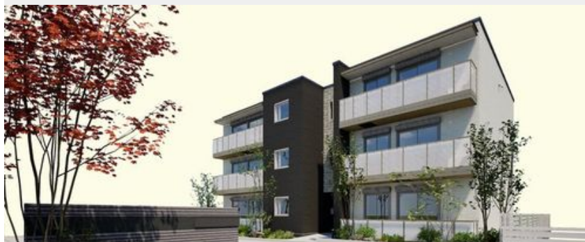
完成予想図のため、実際とは異なる場合がございます。また、絵图中的の周辺環境・植栽・空はイメージです。