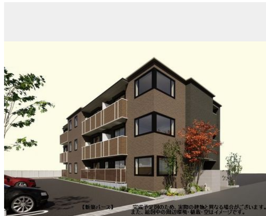
【新築バス】完成予定図のため、実際の建物と異なる場合がございます。また、総图中的の周辺環境・植栽・空はイメージです。