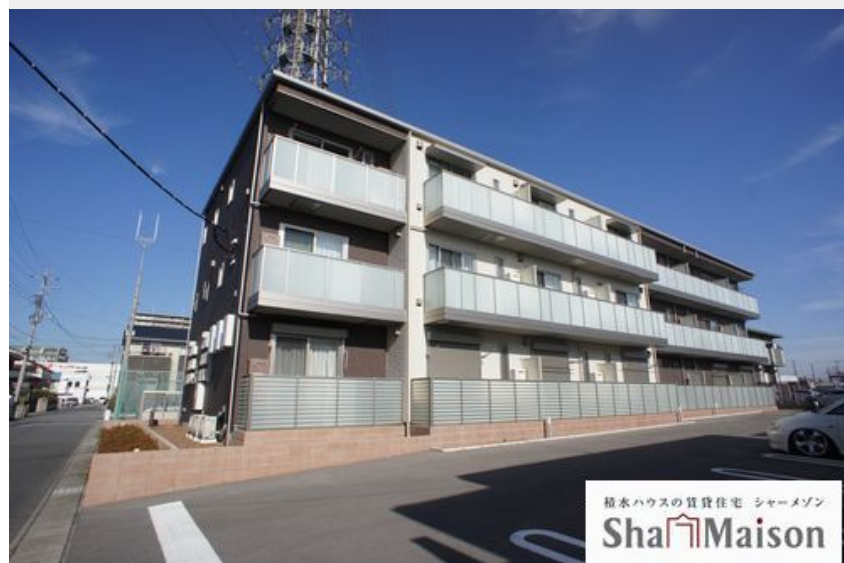
積水ハウスの賃貸住宅 シャーメゾン Sha Maison