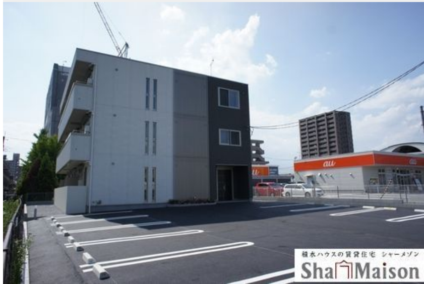
積水ハウスの賃貸住宅 シャーメゾン Sha Maison