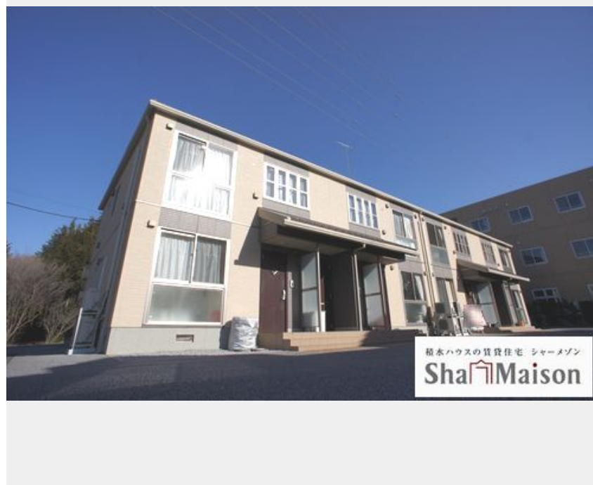
積水ハウスの賃貸住宅 シャーメゾン Sha Maison