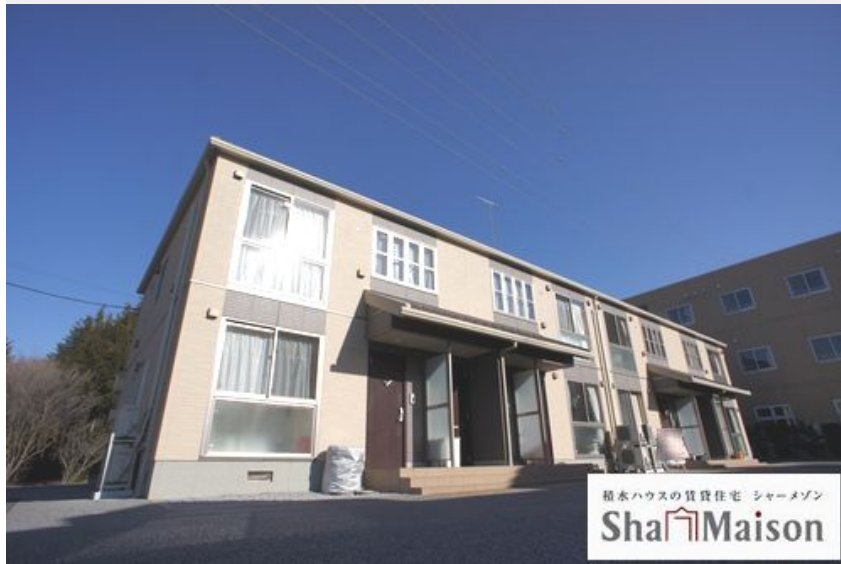
積水ハウスの賃貸住宅 シャーメゾン Sha Maison