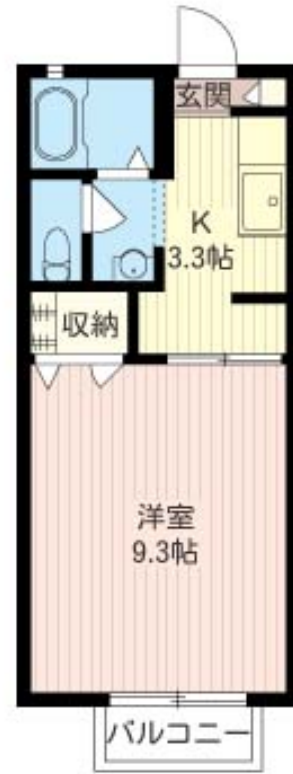
積水ハウスの賃貸住宅 シャーメゾン