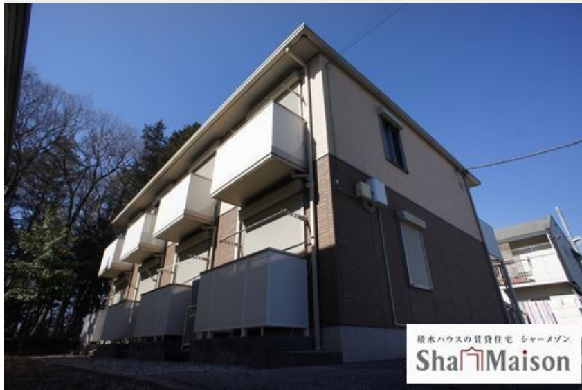
積水ハウスの賃貸住宅 シャーメゾン Sha Maison