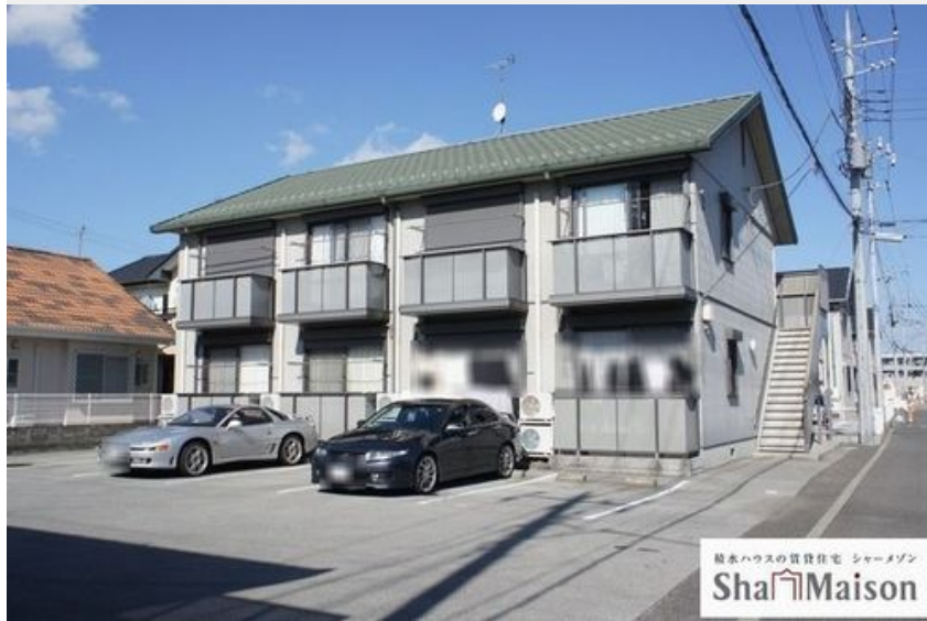
積水ハウスの賃貸住宅 シャーメゾン Sha Maison