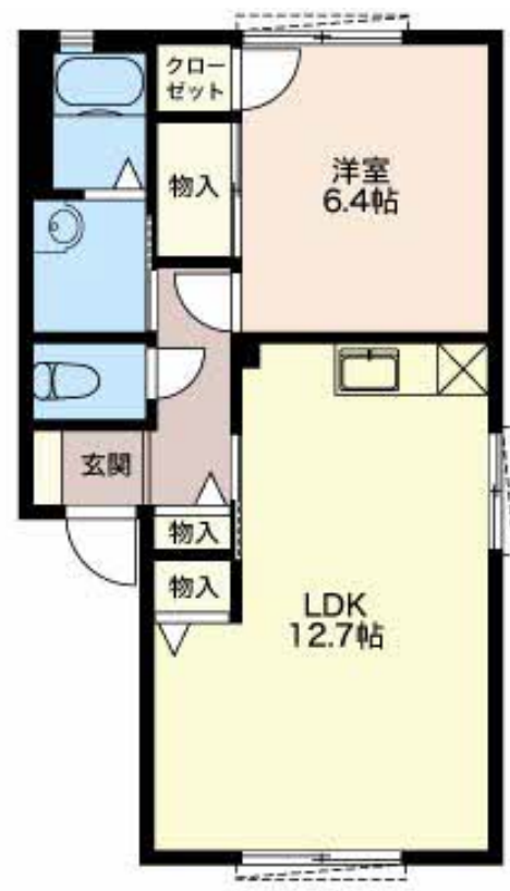
積水ハウスの賃貸住宅 シャーメゾン